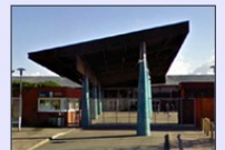
Collège du Pays Blanc